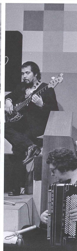
"Het is onze heilige plicht om kinderen vreselijk au sérieux te nemen"