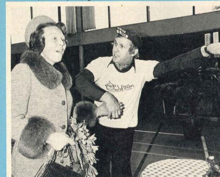
Opnieuw maken de Prinses en de kinderkomiek hun rondedans.