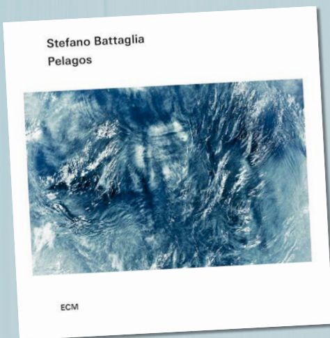
BATTAGLIA PELAGOS STEFANO BATTAGLIA ECM (2CD) VKZ.NL/18647 € 33,99

PPS. Zoek de plaatjes bij de namen Gaudí, Crujff, Dalí en MILO. PS. Jouw held is een lieveheersbeestje? Een ballon? Een buurmeisje...? PPS. Wolfje Mozart kon van achteren naar voren praten.