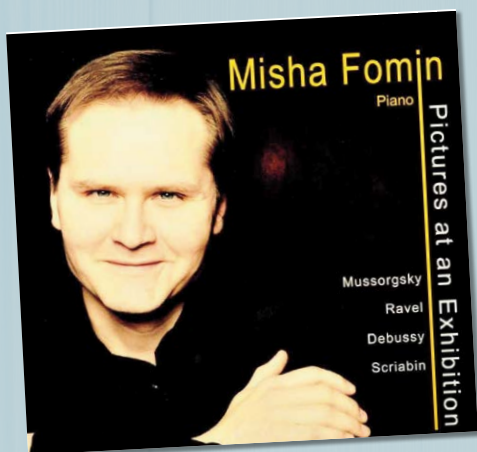
MOESSORFSKI PICTURES AT AN EXHIBITION MISHA FOMIN ZWART RECORDS VKZ.NL/19126 € 17,99