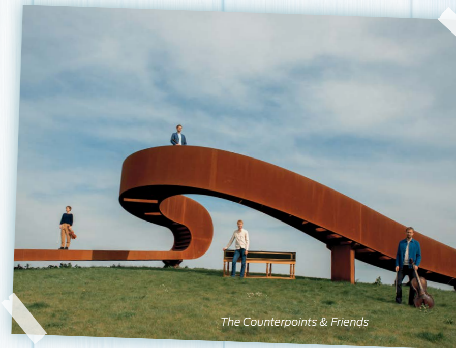
The Counterpoints & Friends