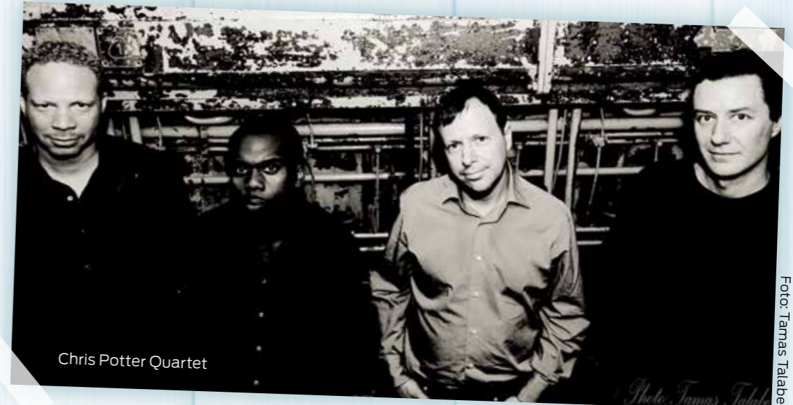
Chris Potter Quartet

Cd: Asian Fields Variations . Met Louis Sclavis. Een grootmeester. Mooie combi met viool en cello. Musici die elkaar door en door kennen. Elk componeert voor deze cd. Je wordt meegenomen. Mysterieus. Ik wil één woord gebruiken voor de cd: edel.