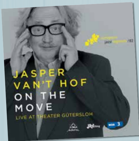
JASPER VAN 'T HOF ON THE MOVE LIVE AT THEATER GÜTERSLOH INTUITION VKZ.NL/19347 € 22,99