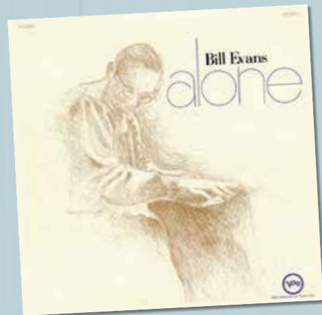
ALONE BILL EVANS VERVE VKZ.NL/19253 € 10,99

Stel je voor. Je gaat naar school en je zit in je eentje of met z'n tweeën in de klas. Dat is wel wat anders dan met z'n dertigen.*