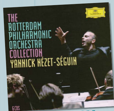
THE ROTTERDAM PHILHARMONIC ORCHESTRA COLLECTION O.L.V. YANNICK NÉZET-SÉGUIN DG 028948353453 VKZ.NL/20449 € 35,99