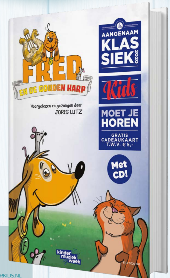
FRED EN DE GOUDEN HARP STEP 2020001 VKZ.NL/20248 € 9,99 WWW.AANGENAAMKLASSIEKFORKIDS.NL