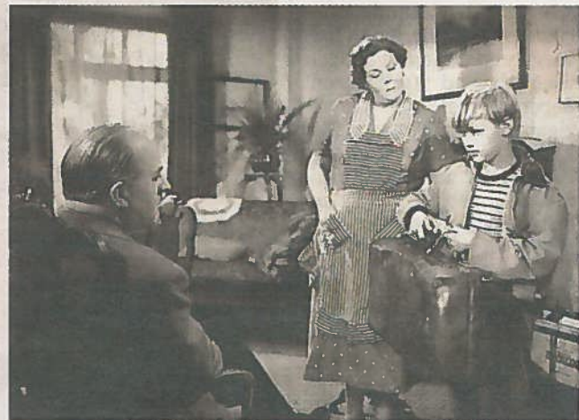
Als negenjarig jochie stond hij voor het eerst voor de camera's in de film Sterren Stralen .

„In mijn geval door veel te ondernemen. Ik sport regelmatig en ik ben nog steeds stevig aan het werk. Ik heb net het Nieuwjaarsconcert