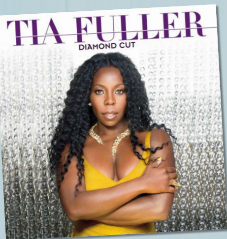
TIA FULLER DIAMOND CUT MACK AVENUE VKZ.NL/18541 € 23,99

PS. 'Het geheugen van Tilburg' PPS. Wat zijn wasrollen? PS. Ik verloot onder de goede oplossingen de cd The Young Persons Guide to the Orchestra & the Big Band . Is in het Nederlands. De meesters en juffen kunnen meedoen. Zet je adres in de mail.