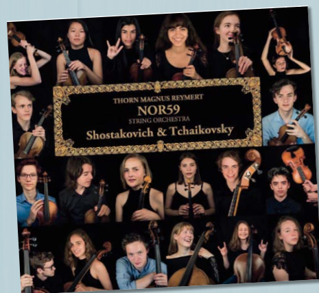
SJOSTAKOVITSJ, TSJAIKOVSKI SERENADE FOR STRING ORCHESTRA e.a. NOR59 STRING ORCHESTRA, THORN MAGNUS REYMERT EVOE VKZ.NL/18542 € 17,99