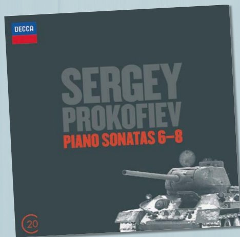
PROKOFJEV PIANO SONATAS 6-8 VLADIMIR ASHKENAY DECCA VKZ.NL/19 361 € 8,99