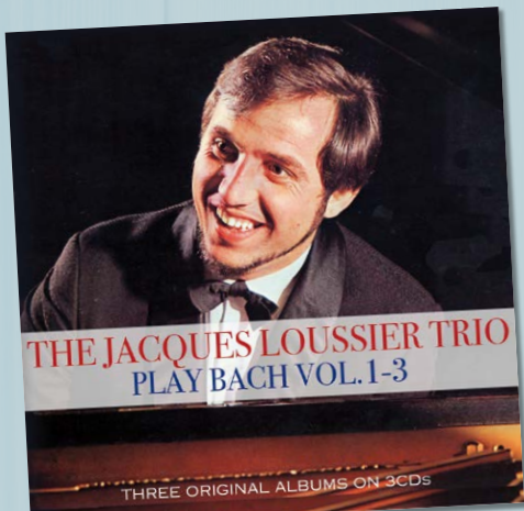
PLAY BACH VOL. 1-3 THE JACQUES LOUSSIER TRIO NOT NOW (3CD) VKZ.NL/19 360 € 9,50

PPS. Er zitten nog 2 d/dt fouten in dit stukje. Waar? Ik verlood een pakketje van 3 cd's PS. Kladden is hetzelfde als kliederen of knoeien. Ik klad, jij kladt, hij kladt PPS. Alle columns zijn na te lezen op www.edwinrutton.nl bij LEZEN