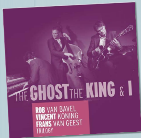
TRILOGY THE GHOST, THE KING & I ROB VAN BAVEL e.a. DAYBREAK VKZ.NL/19648 € 17,99

Het nieuwe jaar begint met de A van 'Aanvang' en eindigt met de Z van 'Zo, tis welletjes'. Elk concert begint met de noot A van de hobo sapiens om de stemming erin te brengen. Ik krijg altijd de kriebels bij het stemmen van het orkest: gespannen verwachting! In geval van een proefwerkje op school met de vraag "Wat is de titel van de kortste en meest gespeelde compositie ter wereld?" is hier alvast het antwoord: 'A'.