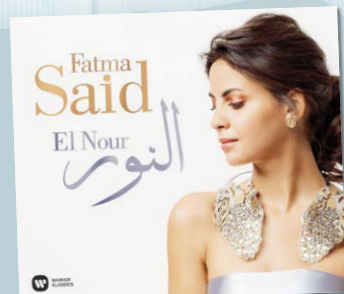
EL NOUR FATMA SAID e.a. WARNER 0190295233600 VKZ.NL/20640 € 22,99