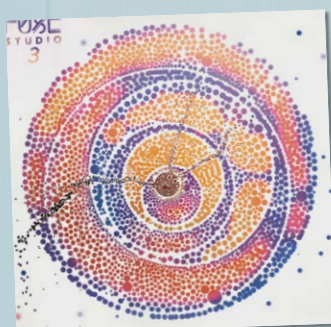
CAGE, ROUKENS e.a. STUDIO 3 FUZE WARNER 0190296800764 VKZ.NL/20656 € 20,99

Dit is de laatste Klassieke Kinderzaken van dit jaar.