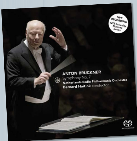
BRUCKNER SYMPHONY NO. 7 RADIO FILHARMONISCH ORKEST O.L.V. BERNARD HAITINK CHALLENGE CLASSICS 0608917289527 VKZ.NL/215657 € 24,99